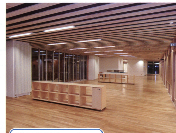
学年多目的スペース

各学年5部屋ずつ、1・2年生は南側、3年生は東側にあります。大きい窓から光と風を取り込むことができます。黒板の左には65型の大型テレビが設置され、きれいな画像を使い学習効果を高めます。