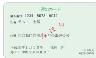
(表面) 通知カード (裏面)