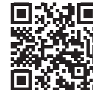
庄内交通(株) ホームページ