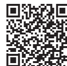
パソコン・スマートフォン