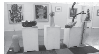
2022年総合文化祭の展示