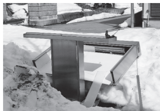
強風で倒壊した看板