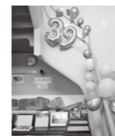
※昨年のぴっかり相模の様子